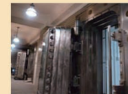
(上) 館内 (下) 地下ギャラリー

手紙を投函したり、一緒に写真を撮ると幸せになると言われているピンクのポスト。インフォメーションカウンターでは手紙に記念スタンプを押せます。