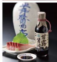
山陰独特の甘味ある刺身用醤油