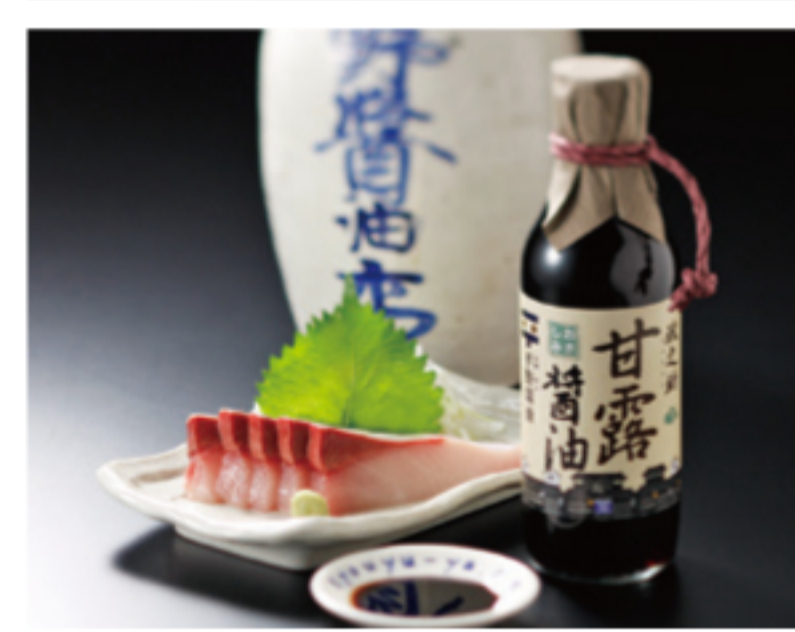
山陰独特の甘味ある刺身用醤油