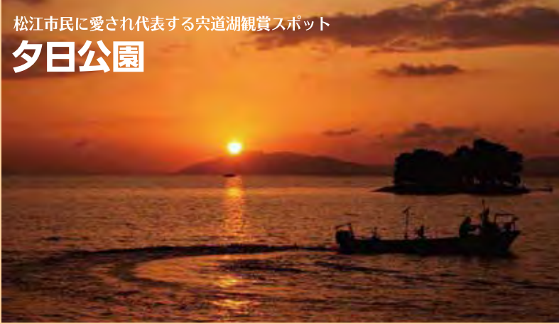
松江市民に愛され代表する宍道湖観賞スポット 夕日公園