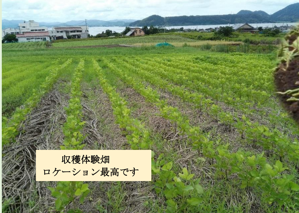
収穫体験畑 ロケーション最高です