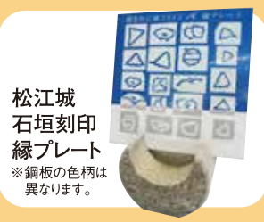
松江城 石垣刻印 縁プレート ※銅板の色柄は 異なります。