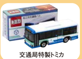
交通局特製トミカ