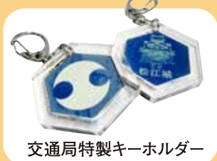
交通局特製キーホルダー